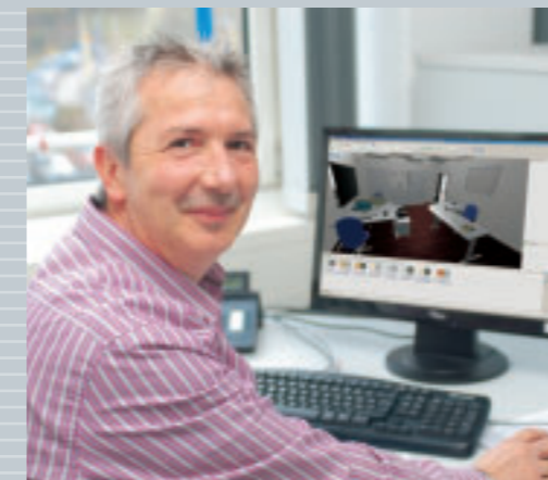
Projektplanung vom Profi

Wir würden uns immer wieder so entscheiden. Und in Zukunft werden wir sicherlich mehr und enger mit Schäfer Shop zusammenarbeiten. Das steht für uns jetzt schon fest.