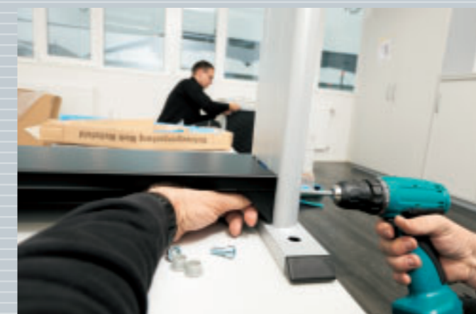
Unser versiertes Montage-Team im Einsatz.

Kein Wunder, dass beide Seiten zufrieden auf dieses Projekt zurück blicken: „Als Unternehmer weiß ich, wie schwer es ist, Kunden zufrieden zu stellen. Schäfer Shop hat das geschafft.“