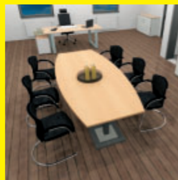
Das Chefbüro: mit CAD geplant...

Natürlich hatten wir Sonderwünsche: Die Stellung der Schreibtische, der Schränke, die Fronten, die Funktionalitäten der Möbel - wir hatten eine ganze Liste von Besonderheiten, die berücksichtigt werden mussten. Die wurden alle ohne Probleme in die Planung miteinbezogen und genauso realisiert. Das lief alles 1A, vom Anfang bis zum Ende vollkommen reibungslos.