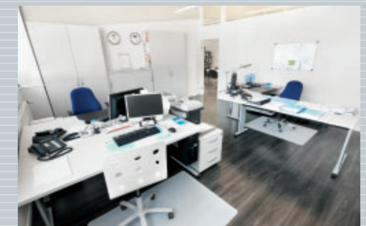
Fachmännisch montiert: Das bezugsfertige Büro.